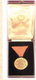
Elde Yapılmış Bir Kuvayı Milliye Bayrağı Kırmızı Şeritli İstiklal Madalyası ve Kutusu