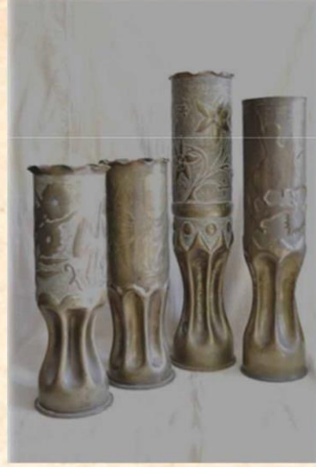
Yunan Ordusunca Türk Siperlerine Atılmış Top Mermisi Boş Kovanlarının Vazoya Dönüştürülmüş Örnekleri