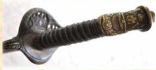
Milli Mücadelede Kullanılmış Bir Yunan Subayı Kılıcı