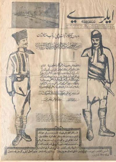
10 Eylül 1922 Tarihli İleri Gazetesi (İstanbul)