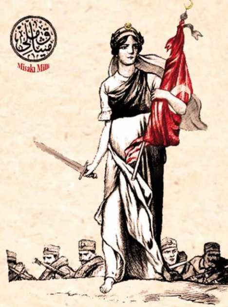
(MİLLİ MÜCADELE PROPAGANDA KARTI)

Atatürk'ün Samsun'a Çıkışı ve Milli Mücadele'nin Başlamasının 100. Yılı Anısına